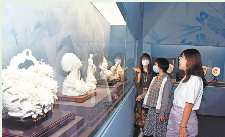
德化白瓷亮相中国国家博物馆

“精美的瓷器做出来、摆出来,还要传出去。”长期以来,德化县紧紧围绕陶瓷为第一产业,2018年启动实施陶瓷产业跨越发展五年行动计划,推动陶瓷产业发展驶上“快车道”;2022年全县陶瓷产值达502亿元,创下了年均11.7%的高速增长,荣膺福建经济发展“十佳”县、中国创新百强县。如今的世界瓷都德化,拥有陶瓷企业4000多家,陶瓷从业人员10多万人(占全县常住人口的三分之一),陶瓷产品远销190多个国家和地区,是全国最大的陶瓷工艺品、茶具、花盆生产基地。2023年,德化县深入实施“中国白·德化瓷”产业高质量发展五年行动计划。未来五年,德化将坚定实施陶瓷创新战略,实施“陶瓷+”产业融合发展,力争通过扩大国际影响力、增强工艺创新力、提升市场竞争力这“三力引领”,打造陶瓷千亿产业集群,加快建设幸福宜居的世界瓷都。