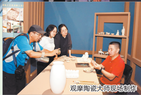
观摩陶瓷大师现场制作