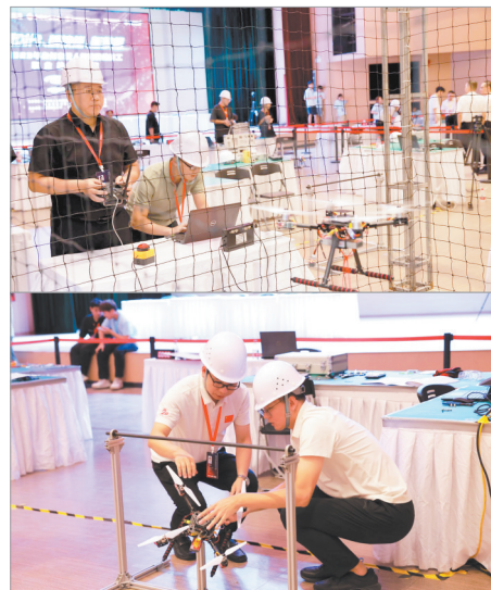
无人机职业技能竞赛现场

本次竞赛由泉州市人社局、泉州市总工会、泉州市退役军人事务局、泉州市教育局联合主办。竞赛中获得各组总成绩第一名的选手(团队),由人社局颁发金牌并给予5000元奖励;各组择优各推荐1人,按程序向人社局申请授予“泉州市技术能手”荣誉称号;获得综合组总成绩第一名的选手(团队),按程序向泉州市总工会申报“泉州市五一劳动奖章”荣誉称号。