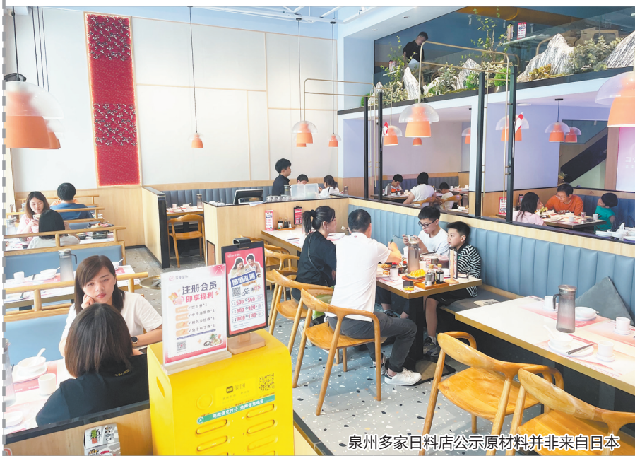
泉州多家日料店公示原材料并非来自日本