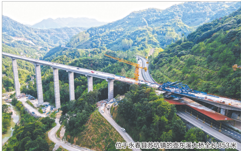
位于永春县苏坑镇的壶东溪大桥全长853米

本报讯(通讯员施栋梁 记者陈小芬 文/图)9月9日,随最后一泵混凝土入模,泉南扩建项目重点控制性工程——壶东溪大桥顺利实现整桥贯通。