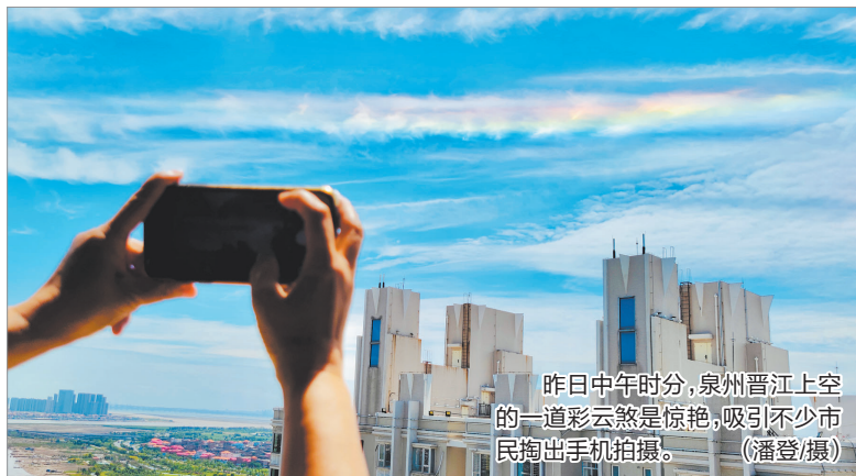
昨日中午时分,泉州晋江上空的一道彩云煞是惊艳,吸引不少市民掏出手机拍摄。

随着副热带高压的增强,“休假”了十来天的太阳终于挣脱云层的束缚,昨日白天也迎来了久违的艳阳天。午后大部分地区最高气温攀升到了29℃~33℃,炎热再次回归。预计未来三天我市仍旧以多云或阴天为主,午后山区部分地区会有弱降水,最高气温在28℃~32℃,白天在阳光下会比较热。不过现在盛夏已过,早晚的凉意逐渐显露,全市最低气温在22℃~24℃,山区的部分乡镇甚至只有20℃左右。白露时节,昼夜温差大,市民朋友们白天注意防暑防晒的同时,夜间千万不可过度贪凉,注意适时添衣加被,谨防感冒。