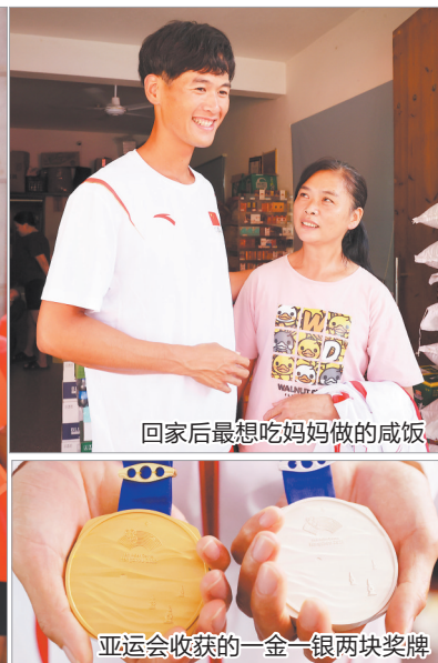
回家后最想吃妈妈做的咸饭