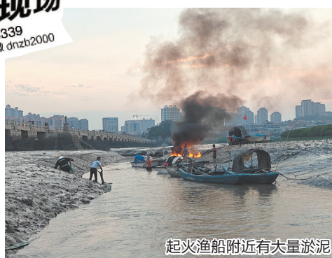
起火渔船附近有大量淤泥