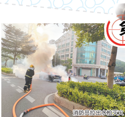
消防员拉出水枪灭火

晋江交警提醒广大市民朋友,自觉遵守交通法律法规,安全文明出行,共创和谐的道路交通环境。