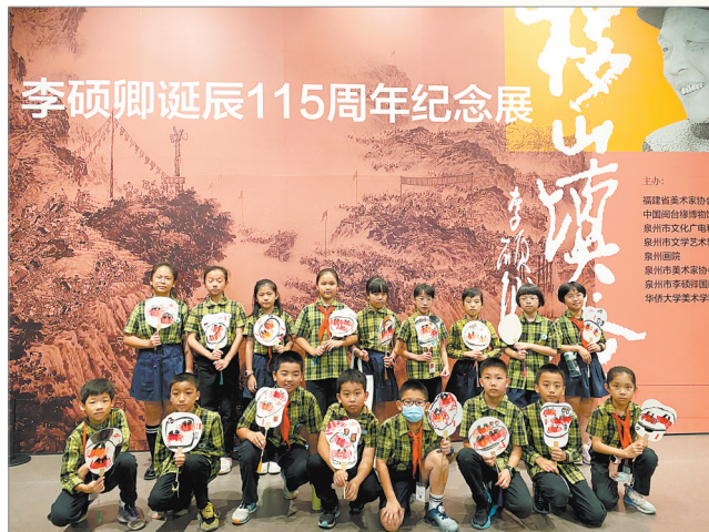
小记者走进中国闽台缘博物馆