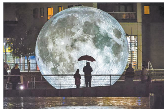
卢克·杰拉姆的装置艺术作品《Museum of the Moon》