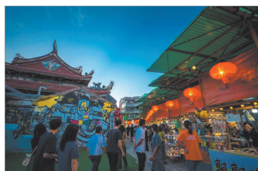
状元街“五脚架艺术市集”被认为是大型的装置艺术