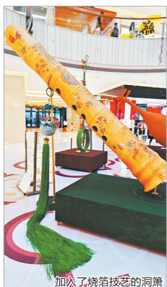
加入了烧箔技艺的洞箫