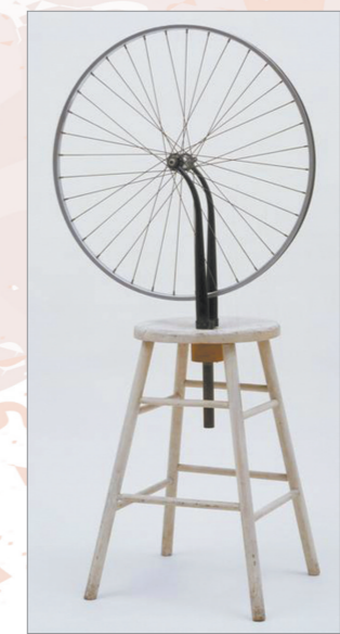
杜尚1913年的《自行车轮》,是世界上第一件装置艺术作品。