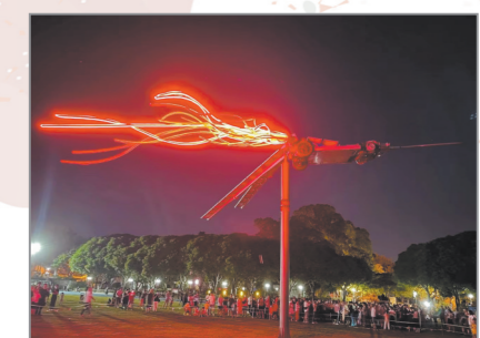
泉州籍著名艺术家吴达新装置艺术作品《红色的蜻蜓》