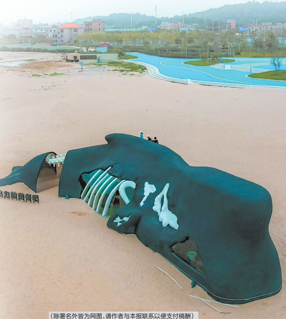
(除署名外皆为网图,请作者与本报联系以便支付稿酬)

“希望未来集合更多的本土手艺人进行艺术再造,并开发更多的美育体验课程;通过DIY日常手工用品的创意设计引领、激发公众全面参与的热情。如此,非遗手工艺不仅会大量出现在日常生活用品上,人们还将自发自觉地将其美学精髓带入生活的方方面面。让泉州装置艺术再次升级,让泉州非遗有更多的艺术表现。”