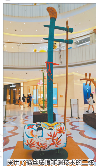
采用了掐丝珐琅非遗技术的二弦

装置艺术始于20世纪60年代。短短几十年,它已成为世界范围内艺术圈中最火热、最活跃、最吸引眼球的一种艺术门类。近几年来,伴随着泉州这座古老的世遗城市的活跃,无论是室内博物馆还是室外的公共空间,都能看到装置艺术的存在,并且在艺术家的运用下,融进非遗技艺,赋予传统以新生。