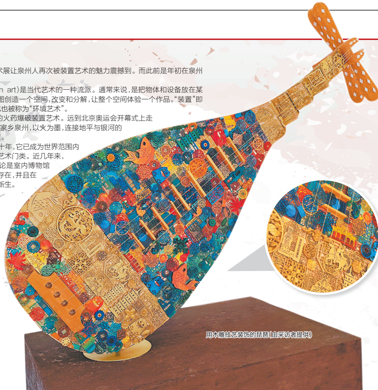
用木雕技艺装饰的琵琶