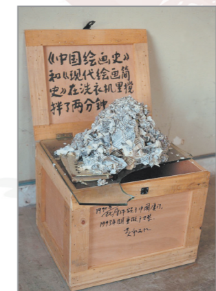
泉州籍艺术家黄永砅《(中国绘画史)和(现代绘画简史)在洗衣机搅拌了两分钟》(1987年),被称为是最具影响力的装置艺术作品之一。