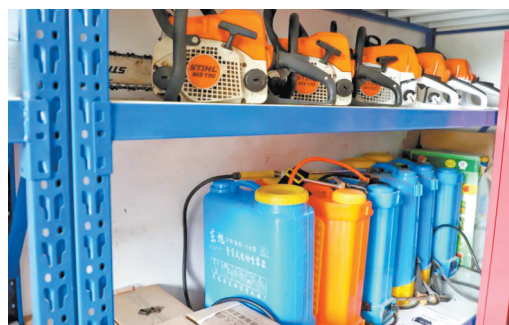
▲ 配备森林防火灭火物资装备

本报讯(通讯员赖良德 记者张素萍 陈思灵 文/图)秋冬季节是森林防火的关键时期。为进一步提高森林火灾应急处置能力,鲤城区成立森林防火应急分队,搭建森林防火视频监控点平台,在6个重点点位设置360度可旋转高清摄像头,并引入烟雾监测系统,通过“人防+技防”手段,筑牢森林防火“最后一公里”。