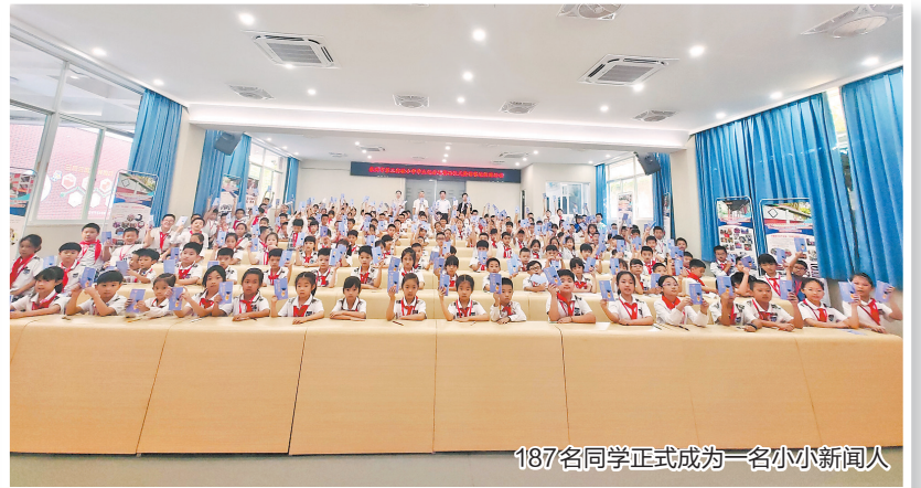
187名同学正式成为一名小小新闻人

泉州市第三实验小学创办于2002年。学校创办21年来,秉承“为未来着想,为一生奠基,为孩子打造成长的乐园”的办学宗旨,以“创一流品牌,办一流名校”为办学目标,践行“以质量树品牌,以特色促发展,以服务为宗旨”的办学理念,形成“开放式、小班化、实验性”的办学特色和优势。学校先后荣获“全