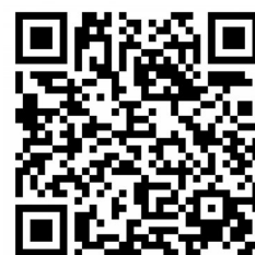
扫描二维码 了解更多信息

车辆驾驶到服务区或驶离高速等安全的位置,停车检查,更换驾驶员,确保人、车安全万无一失,避免因突发疾病引发交通事故。