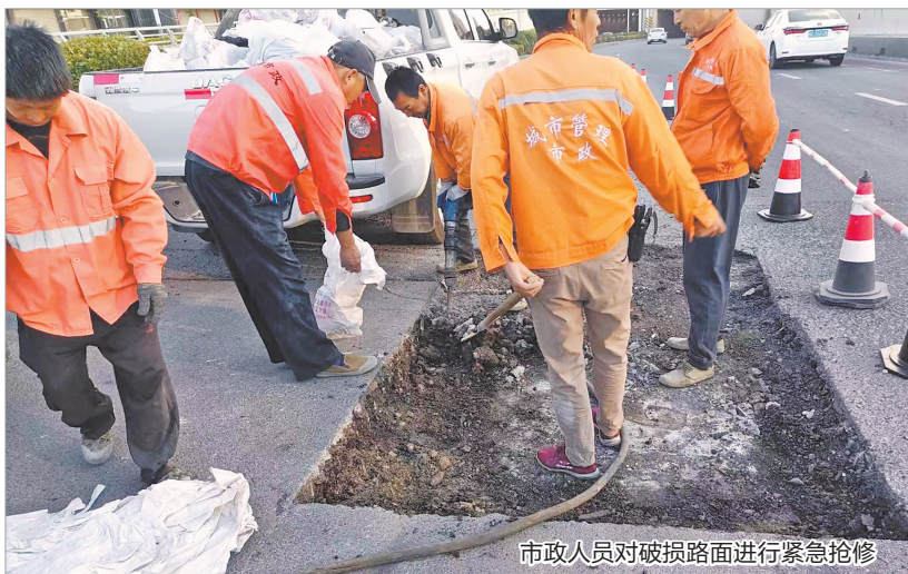
市政人员对破损路面进行紧急抢修

“我中心已于19日安排先行抢修。”市城管局市政中心相关负责人表示,本次病害处置要先清理破损路面并修复受损路基,最后铺筑沥青混凝土面层。21日晚,该路段路面已修复完毕,恢复正常通行。