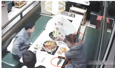
老鼠从天花板掉下(画圈处)

12月8日,有浙江义乌的消费者爆料称自己在吃饭时,突然有两只老鼠“从天而降”,其中一位消费者称被抓破头皮。