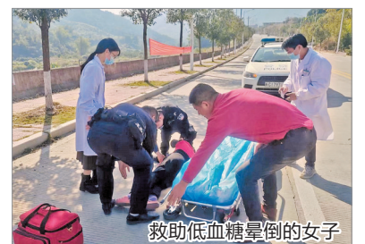
救助低血糖晕倒的女子

12月10日下午1时许,在安溪湖头镇前进路,一女子因低血糖突然晕倒。巡逻至此的湖头派出所民警发