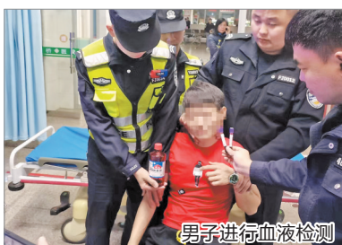
男子进行血液检测

早报讯(记者陈祥木 苏玮杰 通讯员连月棋 文/图)近日,安溪官桥一男子酒后骑车晕倒路边,经血液检测,酒精含量值高达445.26mg/100ml,约为醉酒驾驶标准的5.5倍!据悉,这是醉驾入刑以来,安溪查处到的醉驾行为中,血液酒精含量的最高数值。