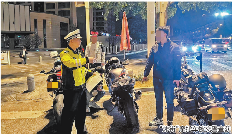
“炸街”摩托车被交警查获