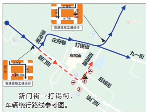
新门街→打锡街,车辆绕行路线参考图。

早报讯(融媒体记者傅恒 通讯员傅振锋 文/图)记者从鲤城交警大队获悉,鉴于古城片区排口整治工程需要,泉州水务工程建设集团有限公司拟对百源路进行路面开挖安装污水智能分流井,为确保工程期间道路交通安全,1月11日0时至2月4日24时,交警部门将对施工道路实施交通限制措施。届时,百源路(涂门街至后城街路段)实行机动车自北向南单向通行,途经车辆请注意绕行。