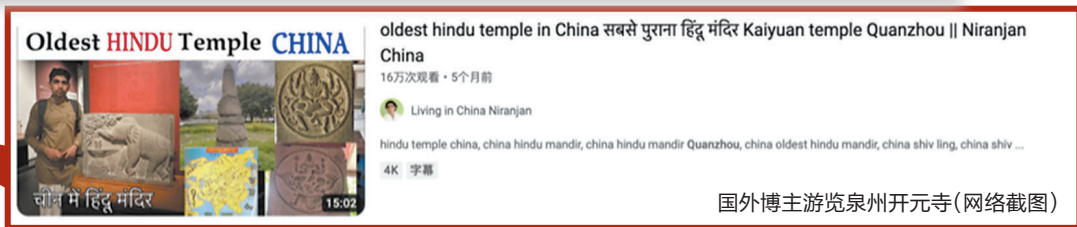
国外博主游览泉州开元寺