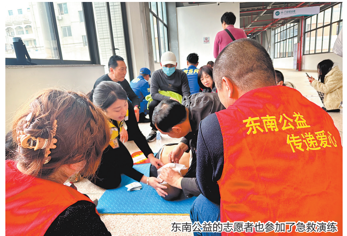
东南公益的志愿者也参加了急救演练

1月20日,泉州市举办“120-国家急救日”倡议活动。活动由泉州市委文明办、泉州市卫生健康委员会、泉州市科协、泉州市急救指挥中心、各县(市、区)急救中心等部门联合指导、主办。