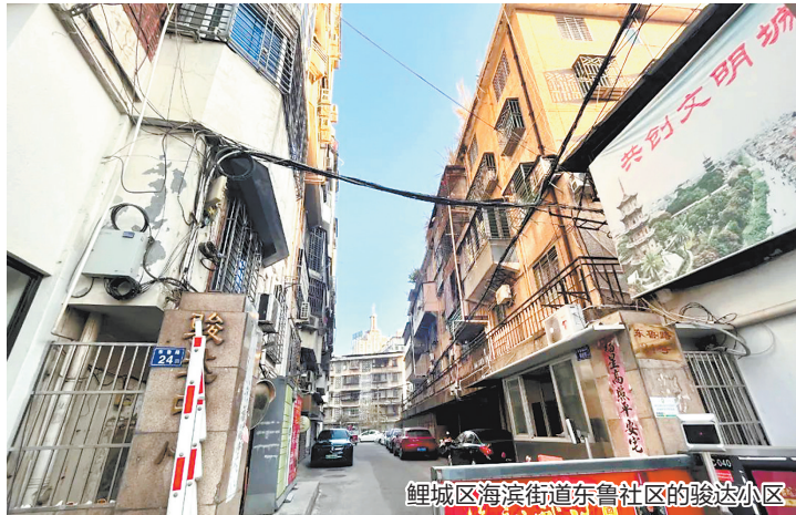
鲤城区海滨街道东鲁社区的骏达小区

早报讯 (融媒体记者张素萍 通讯员许培吟 文/图)老旧小区改造是推进城市更新的重要举措,也是造福群众的重大民生工程。目前,鲤城区2024年老旧小区改造计划已启动,共涉及小区13个,惠及44栋楼1336户居民。