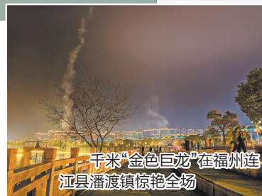
千米“金色巨龙”在福州连江县潘渡镇惊艳全场

今年迎来史上最长春节假期,返乡、探亲、出游多重因素交织,市民休闲旅游热情高涨。记者昨日从福建省文化和旅游厅获悉,春节假日全省接待游客3257.47万人次,实现旅游收入277.18亿元。其中,泉州文旅市场共接待旅游人数818.12万人次,实现旅游收入80.18亿元,游客接待量与旅游总收入均创历史新高,均位居福建全省第一。