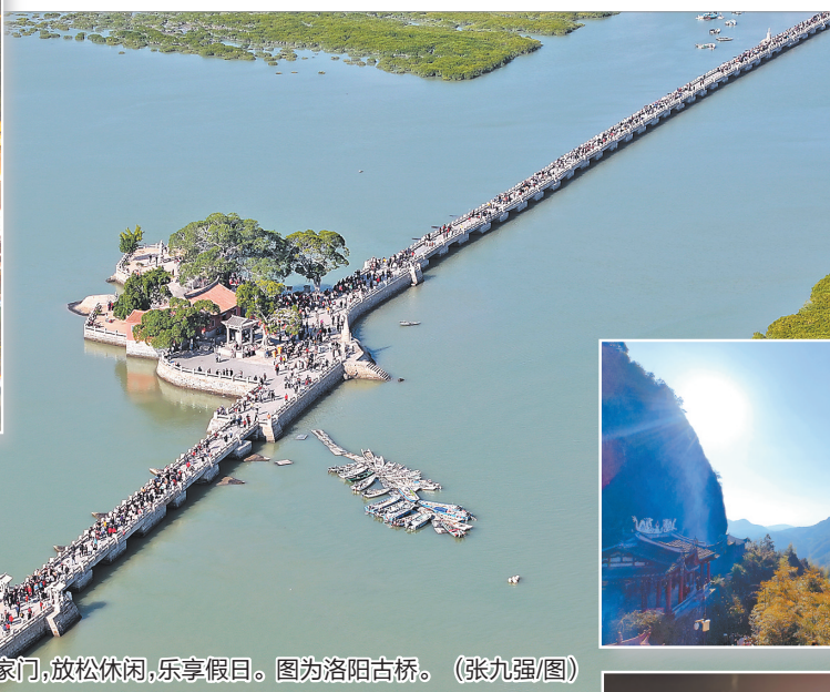
人们走出家门,放松休闲,乐享假日。图为洛阳古桥。