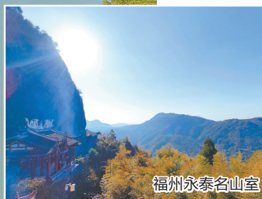
福州永泰名山景区