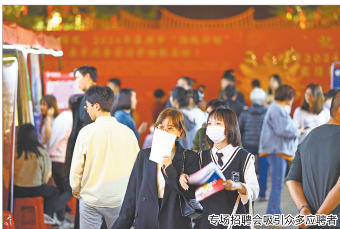
专场招聘会吸引众多应聘者

聘,提供品检员、运营、培训师、技术员、会计等各类就业岗位3000余个,现场吸引1200多名大中专毕业生咨询求职,初步与企业达成意向约300人。现场还设有高校毕业生就业创业政策宣传专区,为应聘者解读就业创业优惠政策。