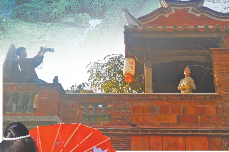
▲梧林传统村落的特色建筑吸引众多游客体验换装人文旅拍