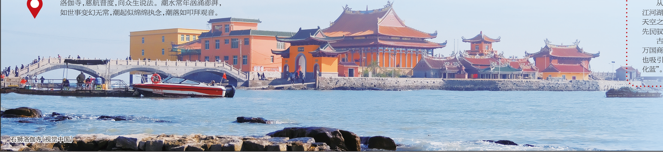
石狮洛伽寺