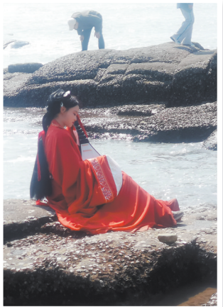
▲游客着古装在洛伽寺拍照游玩