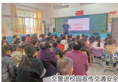
交警进校园宣传交通安全

活动。通过开展交通安全专题讲座、观看一老一小警示教育片、分发交通安全宣传单和知识手册,进一步增进学生及家长的交通安全知识,提升文明交通意识,全力护航开学季交通安全。