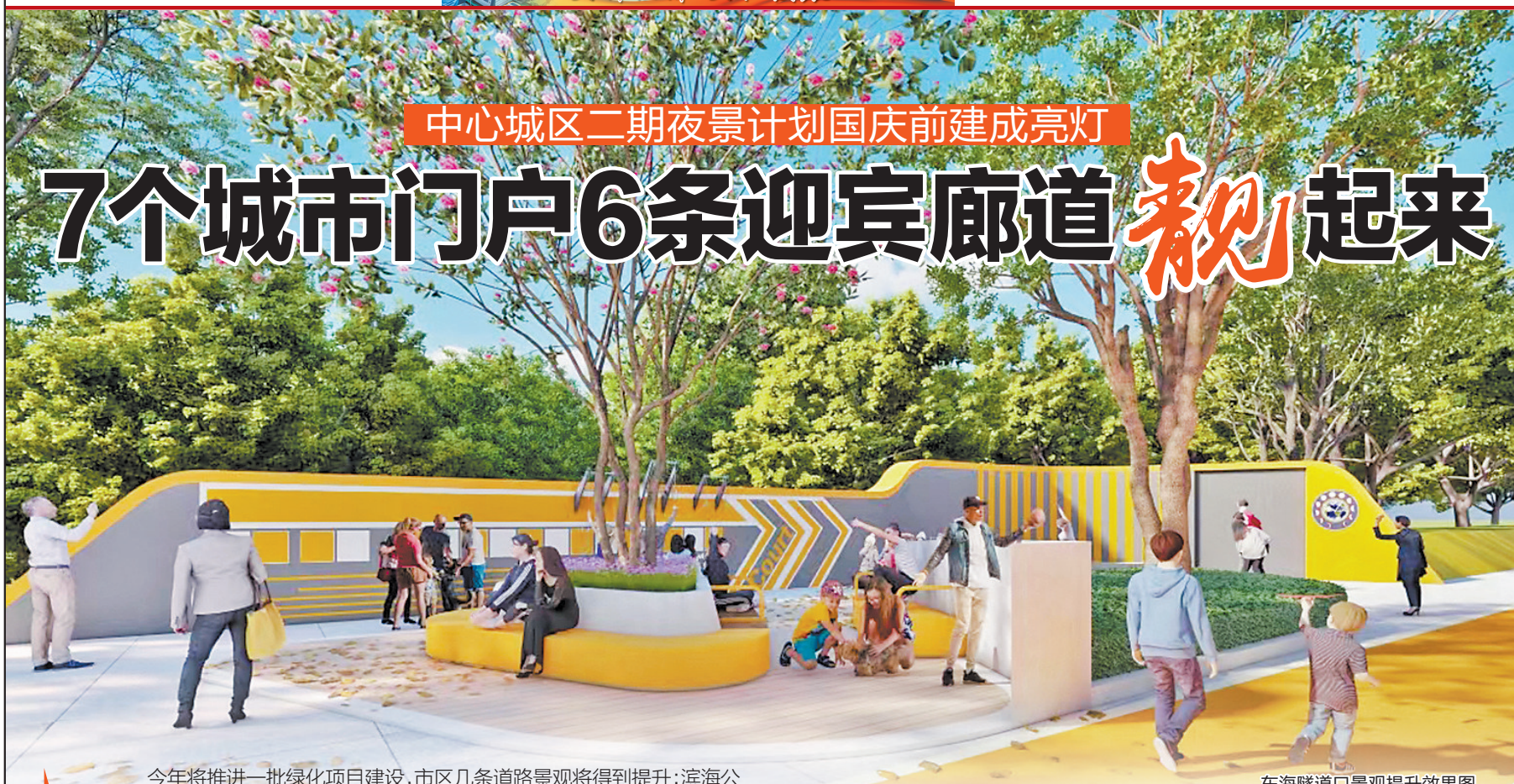
东海隧道口景观提升效果图