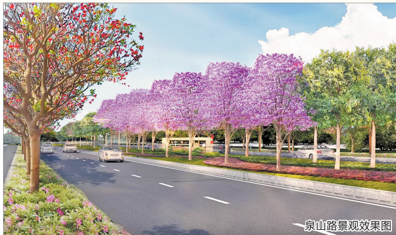
泉山路景观效果图

新建项目方面,重点推进江南大街(南环路—池峰路)道路绿地灾后改造提升项目、西福绿地泵房配套设施改造、泉山路道路绿地灾后改造提升项目、北环城河公园灾后改造提升项目、朋山岭立交连接线(朋山岭立交至双阳路口)道路绿地灾后改造提升项目、城西环路、城北环路、北门街等道路绿地灾后改造提升项目建设。推进泉宁路(滨海街—丰海路)、大兴街(东宏路至府西路)段道路绿地整治提升、东海隧道道路绿地(坪山路—东海隧道)景观改造提升等项目建设。