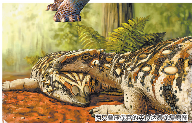
两只叠压保存的英良达泰龙复原图