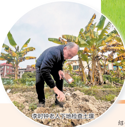
李时钟老人下地检查土壤