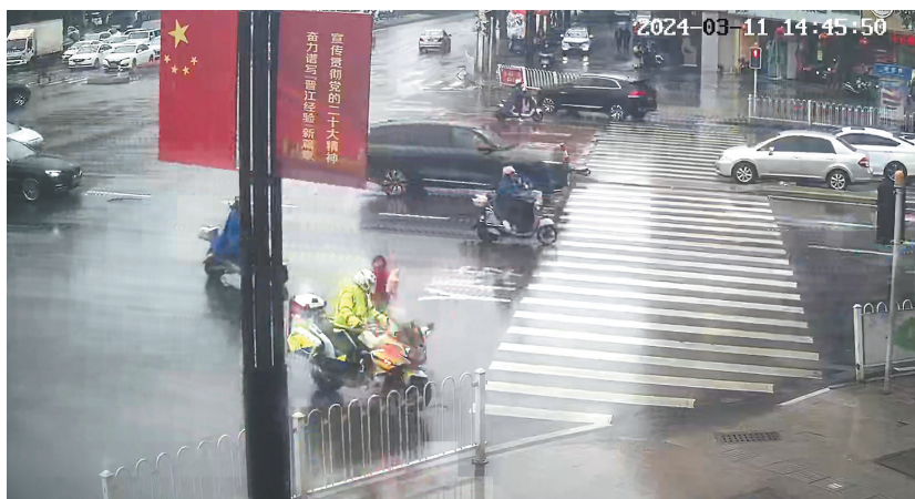
铁骑带女童找妈妈

3月11日下午2时许,天空下着蒙蒙细雨,晋江交警二中队铁骑队员巡逻至和平路湖中灯控区时,发现一名六七岁大的女童抱着一个“小星星”抱枕行走在马路上,不时左右躲闪避让过往车辆,场面十分危险。铁骑队员立即停车将女童带离危险区域。当时正下着雨,女童