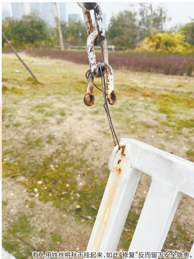
有人用铁丝将秋千挂起来,如此“修复”反而留下安全隐患。