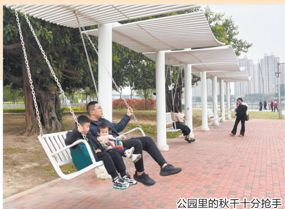
公园里的秋千十分抢手