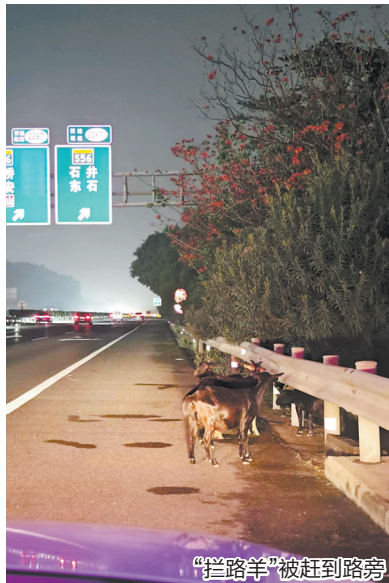
“拦路羊”被赶到路旁

早报讯(融媒体记者林志安 通讯员陈旖旎 文/图)当你夜间在高速公路开车,眼前突然冒出3只羊时,是否会吓出一身冷汗,甚至酿成事故?近日在沈海高速水头段就出现了这样一幕,泉州高速交警接到警情后及时前往处置,顺利化解了危机。