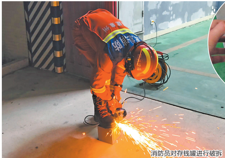
消防员对存钱罐进行破拆