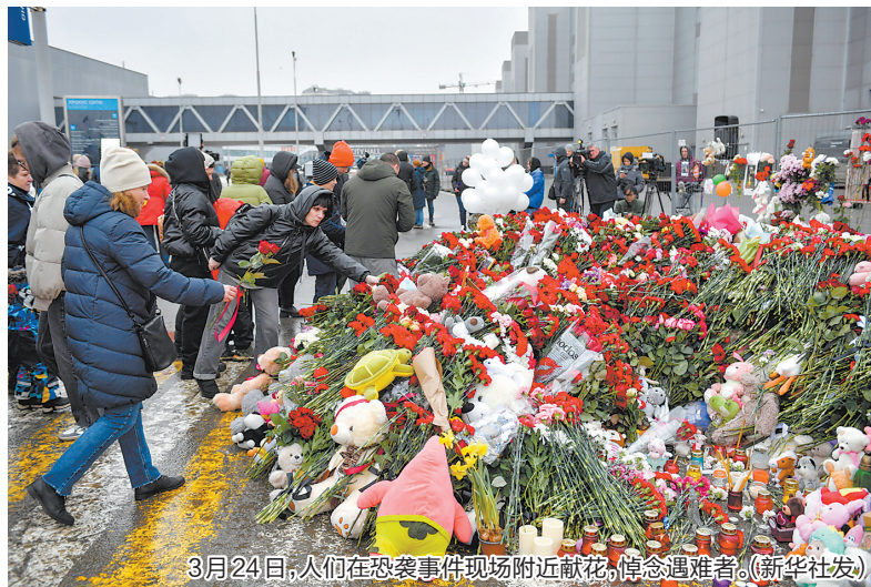
3月24日,人们在恐袭事件现场附近献花,悼念遇难者。