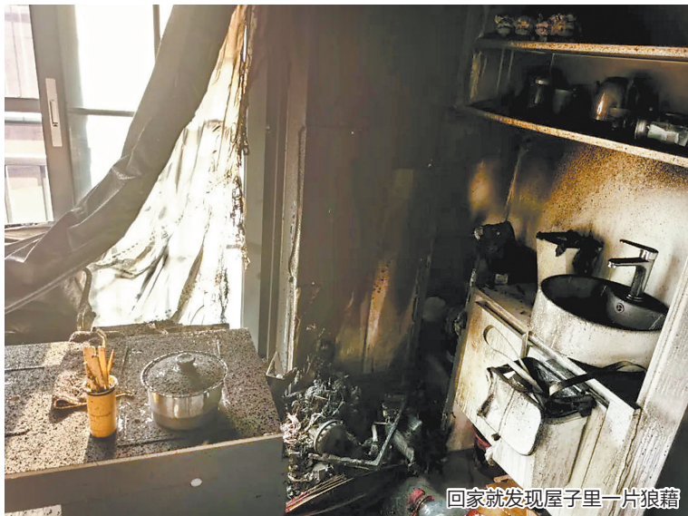
回家就发现屋子里一片狼藉

“出个门回来,为啥家就被烧了呢?”近日,广东梅州黄女士夫妻俩刚从老家回来,一开门便被眼前的场景惊呆了——整个房子的墙体、地面全被熏黑,在客厅角落的扫地机器人被烧得面目全非,旁边的茶吧机、茶台、柜子等都不同程度地被烧毁,家中两只猫咪也不幸死亡。