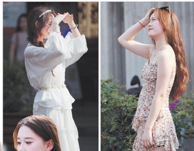
昨日市区艳阳高照,气温飙高,不少市民换上夏装出行。