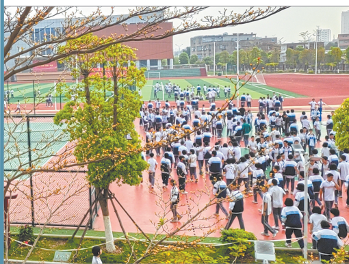
泉州七中师生有序疏散,安全避险。

早报讯(融媒体记者龚翠玲 通讯员蔡国清)昨日台湾花莲海域发生的7.3级地震,泉州震感明显。记者了解到,当时中学刚进入课堂,而小学幼儿园正值入校高峰期,泉州各校迅速反应,有序组织快速疏散。