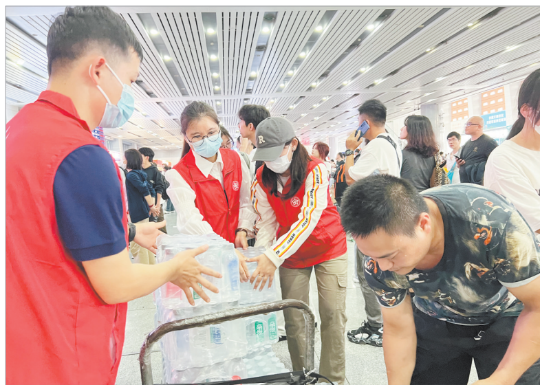
昨日,因地震致动车大量晚点,众多旅客滞留在泉州动车站。泉州市文旅局获悉后,立即组织干部职工带着1万多瓶矿泉水前往动车站,免费分发给滞留旅客。

商,密切关注震情发展趋势。严格落实24小时震情应急值班制度和岗位责任制,时刻紧盯震情变化,按时上报相关震情续报,为群众答疑解惑,打破地震谣言,消除市民恐慌。市地震局副局长叶威介绍,目前,我市已建成地震预警信息发布终端4000余处,预警专用广播系统700余套,覆盖面较广。市民可以通过两条官方渠道了解到准确的地震预警及相关信息:一是关注泉州地震局公众号,二是安装中国地震预警APP。叶威提醒市民,除了从官方渠道获取地震信息,平常生活中也应了解和掌握一些地震自救互救常识。“地震的过程十分短暂,只有掌握正确、科学的避震方法,才能尽可能将伤害和损失降到最低。”