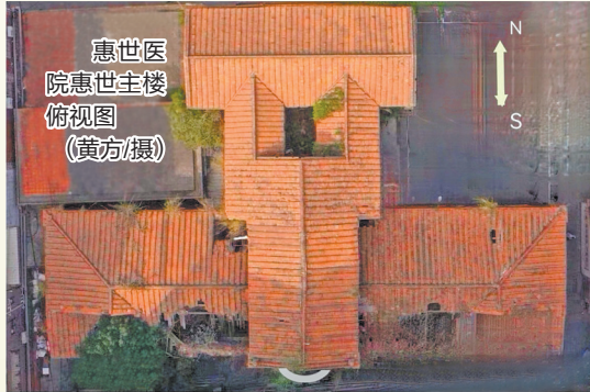
惠世医院惠世主楼俯视图