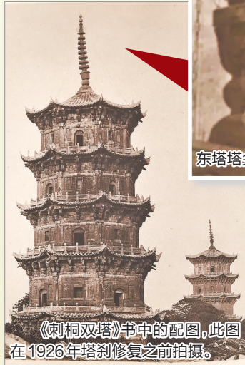
《刺桐双塔》书中的配图,此图在1926年塔刹修复之前拍摄。