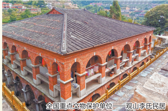
全国重点文物保护单位——观山李氏民居