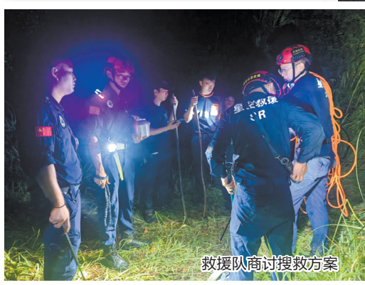
救援队商讨搜救方案