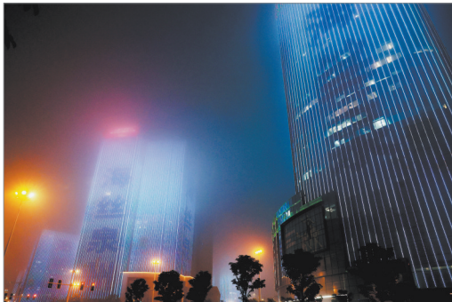
东海中央商务区高楼立面亮屏