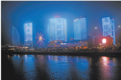
泉州泰禾广场高楼立面亮屏