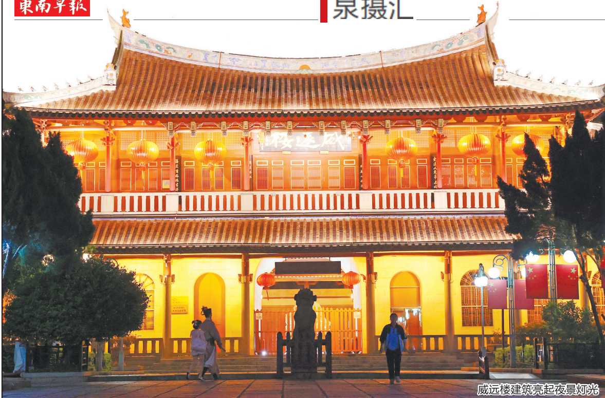
威远楼建筑亮起夜景灯光