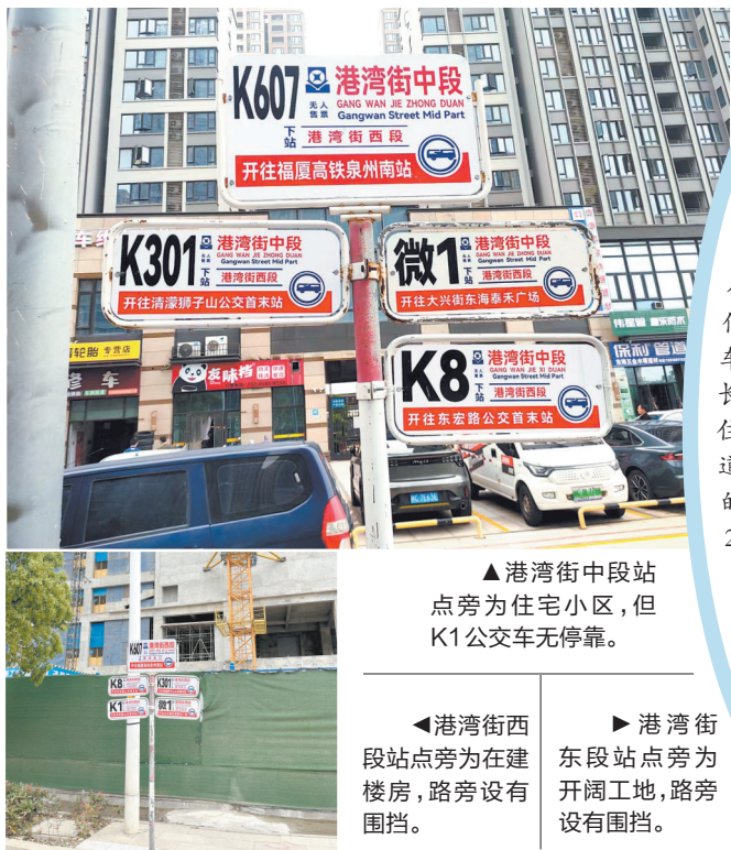
▲ 港湾街中段站点旁为住宅小区,但K1公交车无停靠。