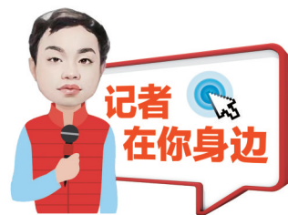
融媒体记者 林志安

“途经我们小区的K1公交车,在小区门口的公交站没有停靠,我们出门去坐车或者下车后回家,都要走挺长一段路。”近日,家住泉州丰泽区东海街道上实·海上海小区的卓先生,拨打本社24小时热线96339反映,希望K1公交车能在小区门口已有的公交站点停靠一下,方便大家出行。