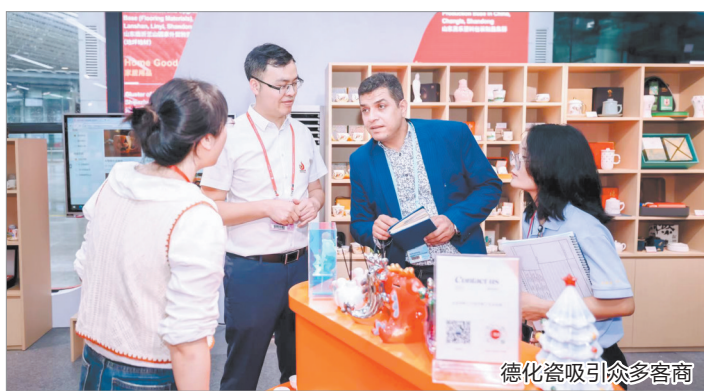
德化瓷吸引众多客商

本报讯(融媒体记者许钺钺 通讯员陈巧灵 江颖斌 文/图)4月23日,第135届中国进出口商品交易会第二期在广州开展,德化119家陶瓷企业携各类精美陶瓷参展并举行推介活动。