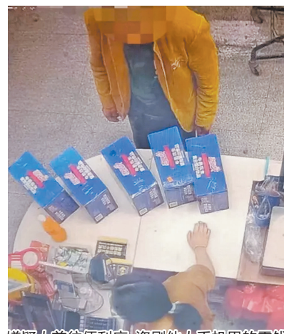
嫌疑人前往便利店，盗刷他人手机里的零钱。

晋江警方提醒，日常生活中，一定要保管好自己的财物，手机也应设置支付密码；若捡到他人遗失物品应及时归还或交给警察处理，切莫因为一时的贪念，触犯法律法规而追悔莫及。