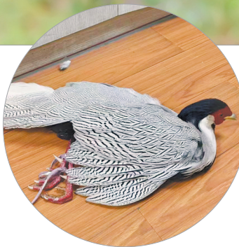
白鹇吃“自助餐”被捕捉

据了解，白鹇以形态优雅著称，被称为“白凤凰”“林中仙子”，属国家二级保护动物，1988年在广东省鸟评选中，白鹇被选为新的省鸟。目前由于栖息地不断受到人类活动影响，野生白鹇濒临灭绝。