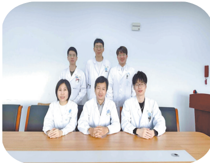
林守卫心血管重症诊疗团队