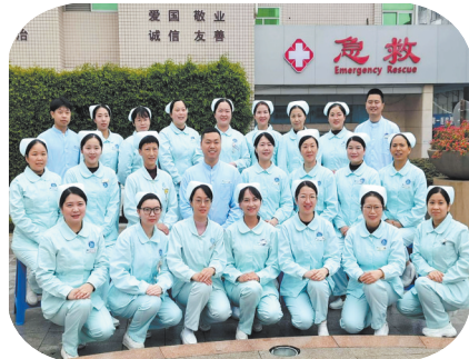
康文委E急诊急救护理团队