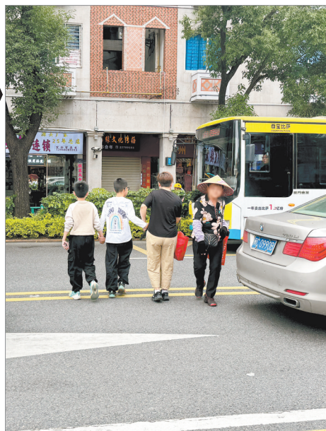
市区涂门街,有行人随意横穿马路,既不文明,也对生命不负责任。