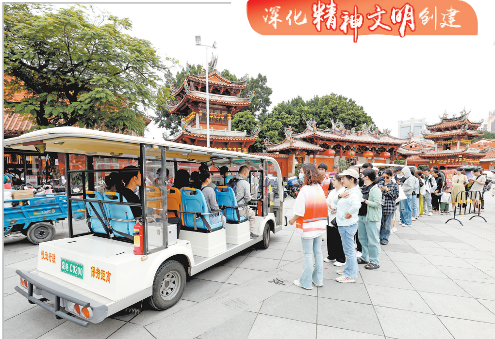
“五一”假期,在天后宫“小白”公交站点,志愿者现场引导,游客自觉依次候车,站点秩序井然。