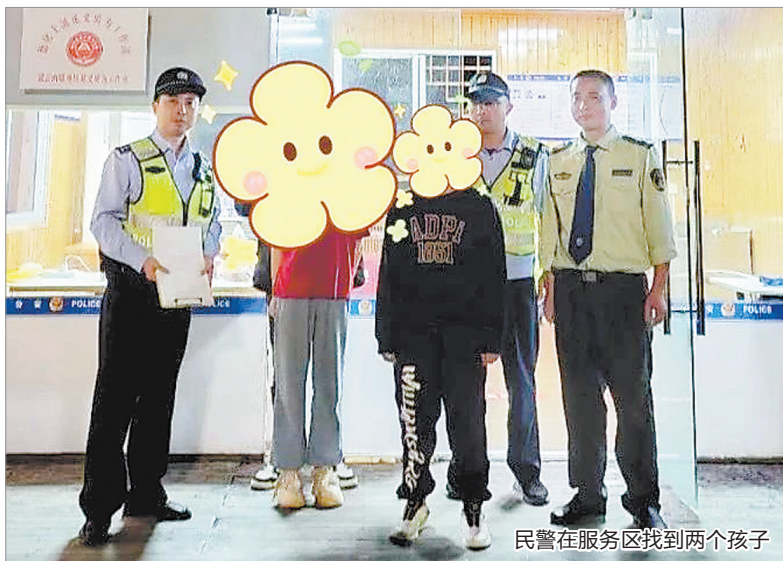
民警在服务区找到两个孩子

在高速公路上寻找孩子的民警也一直没有传来消息,煎熬中又找了20分钟,正当民警商讨下一步寻找计划时,不远处突然出现了两个小小的身影。“孩子在那里!”