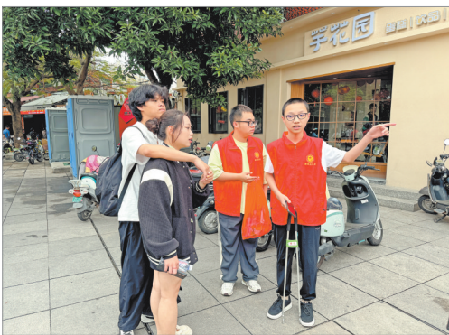
在德济门遗址广场,志愿者向游客提供文明引导、旅游咨询、秩序维护等服务。