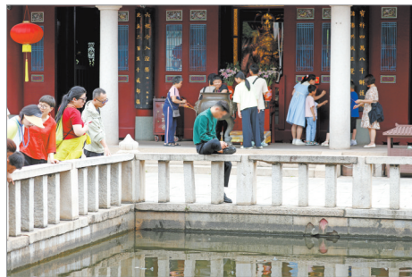
在承天寺内,有游客无视安全隐患坐在水池护栏上休息。