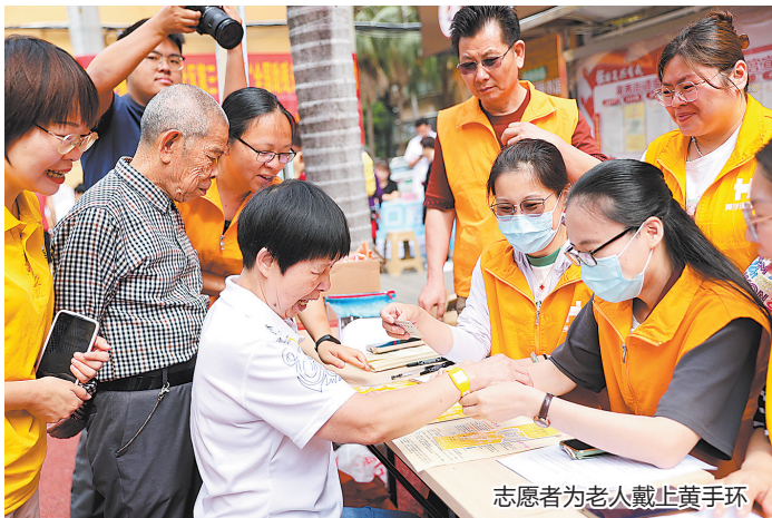
志愿者为老人戴上黄手环

早报讯(融媒体记者高云 陈茗香 胡彦明 王耿华 文/图)昨日上午,在丰泽区泉秀街道泉淮社区,一场主题为“用心点亮爱 温暖回家路”——“5·9无走失日”公益宣传活动吸引了老人们的目光。爱心单位向社区老人免费发放黄手环,防止老人走失,并提供系列健康科普宣传服务。