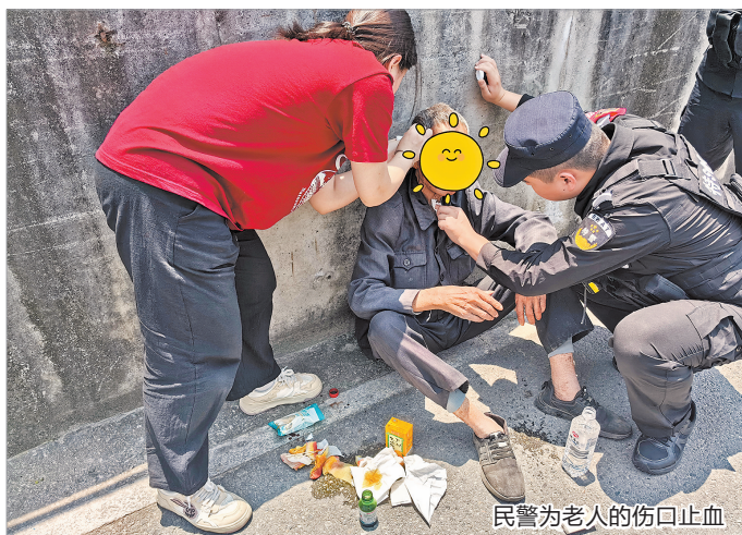
民警为老人的伤口止血

早报讯(融媒体记者许奕梅 通讯员邱丽婷 文/图)“警察同志,这边有位老人摔倒了,头部受伤流血,需要救助。”日前,在台商投资区洛阳镇,一位八旬老伯外出迷路不慎摔伤,热心群众报警后,洛阳派出所民警及时救助,护送老人平安回家。