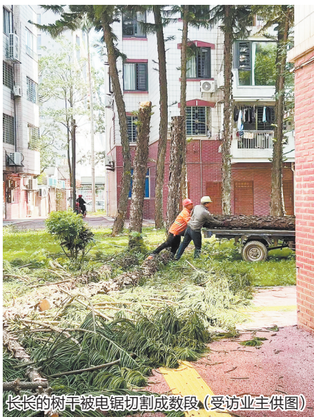
长长的树干被电锯切割成数段