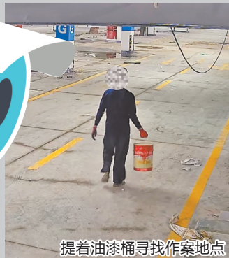
提着油漆桶寻找作案地点