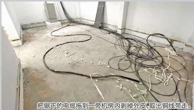
把锯下的电缆拖到一旁机房内剥掉外皮,取出铜线带走。