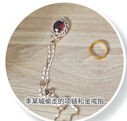
李某城偷走的项链和金戒指

警方提醒: 广大居民要提高防范意识,外出时关好门窗,妥善保管房门及车辆钥匙,不要图省事将钥匙放在消防栓、探照灯、屋外花盆等地方,以免被有心之人惦记,造成损失。