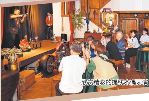
欣赏精彩的提线木偶表演