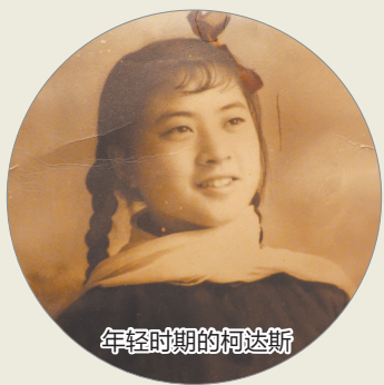
年轻时期的柯达斯