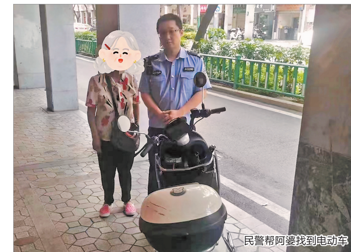
民警帮阿婆找到电动车