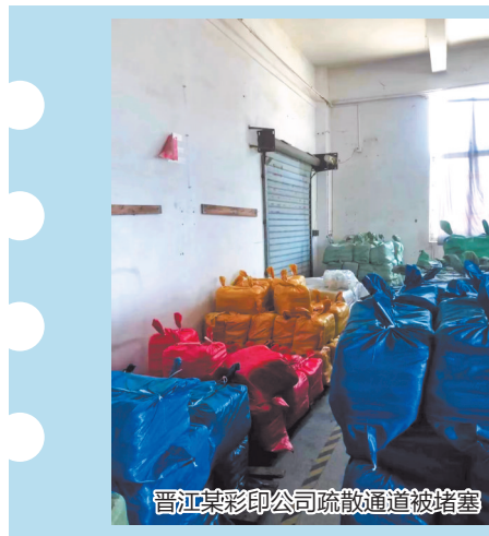
晋江某彩印公司疏散通道被堵塞