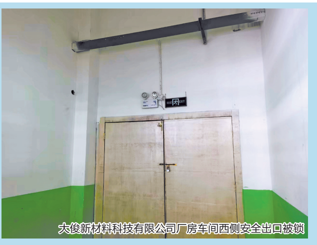
大俊新材料科技有限公司厂房间西侧安全出口被锁

本报讯(融媒体记者傅恒 通讯员黄阿兰 文/图)堵塞疏散通道、安全出口,在火灾发生时将严重影响人员的安全疏散和逃生,造成严重后果。近期,泉州市消防救援支队在开展消防安全检查时,发现了一批存在堵占“生命通道”隐患问题的单位,依法对其进行相应处罚。