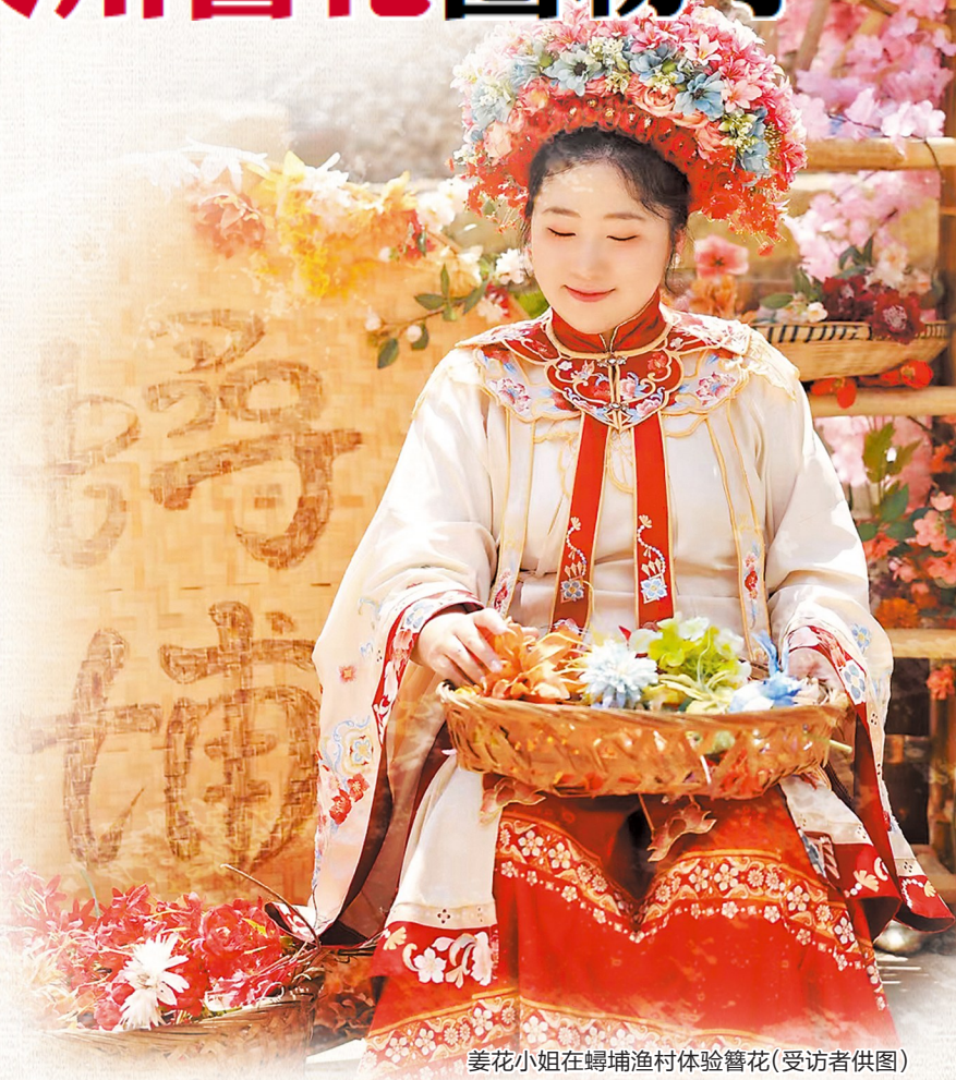
姜花小姐在罍埔渔村体验簪花