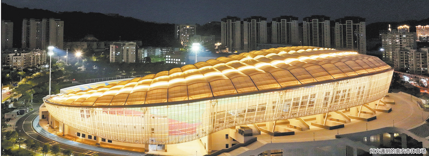
灯火通明的南安市体育场