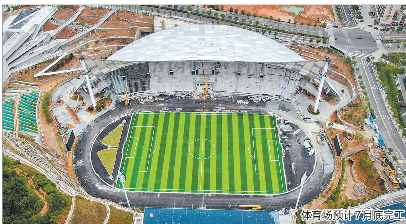
体育场预计7月底完工

据介绍,霞田文体园项目位于德化县龙浔镇丁垵村,规划建成集体育健身、旅游休闲、商务会展、文化体育产业等功能于一体的综合性文体园。