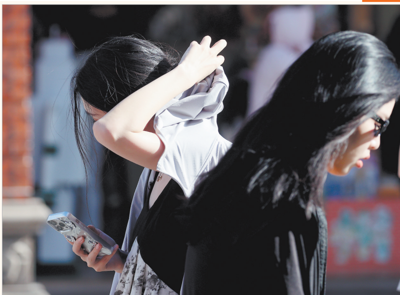
高温来袭!外出的市民注意防晒。