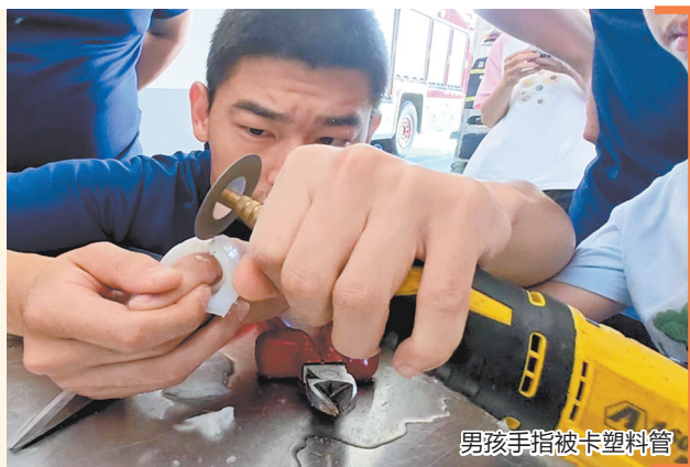
男孩手指被卡塑料管