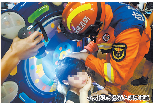
小女孩头发被卷入娱乐设施

卡门锁、卡戒指、卡玩具……随着暑假来临,“熊孩子”总是会被奇奇怪怪的东西卡住,家长们总是又心疼又好笑。据消防部门统计,7月1日以来,接到市民被卡被夹的求助9起。消防员提醒,暑假来临,家长一定要及时对孩子进行安全教育。