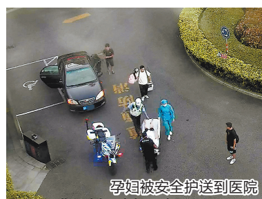
孕妇被安全护送到医院

交警三中队立即安排“铁骑”队员与求助者取得联系,并与车辆驾驶人约定在社马路季延灯控处汇合。18时10分许,与求助者汇合后,“铁骑”队员随即驾驶警用摩托