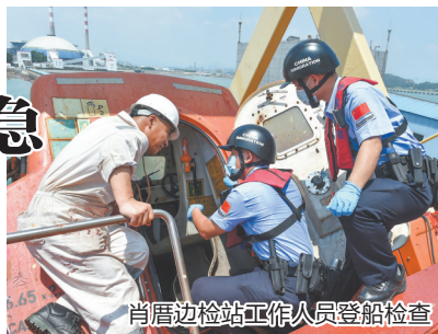
肖厝边检站工作人员登船检查

据悉,泉州口岸进口的煤炭主要用于闽赣两省的相关火电厂发电。随着夏季高温持续,各地电力负载猛增,对进口煤炭的需求不断增大。为有效保障进口发电用煤的供应,肖厝边检站深入企业了解煤炭进口计划,积极开通煤炭专用“绿色通道”,提供24小时通关服务,通过“预审单、人等船、船到即检”等优化便利通关措施,