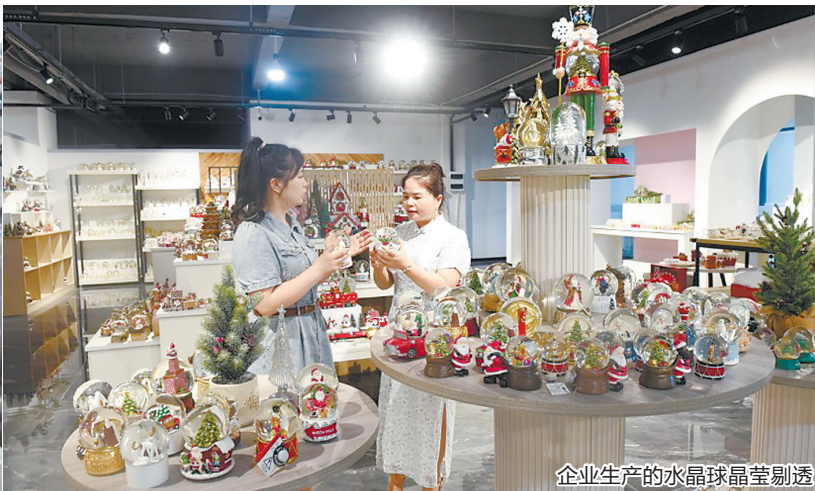
企业生产的水晶球晶莹剔透